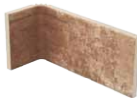
Angolo interno 10x20x10 4"x8"x4" Inside corner Innen-Ecke Angle intérieur 030