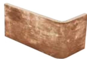
Angolo esterno 10x20x10 4"x8"x4" Out corner Aussenecke Angle extérieur 030

Pezzi Speciali Special Pieces • Formteile • Pièces spéciales Disponibili nei colori: - Available on colours: - Formteile in den Farben: - Disponibles dans les couleurs: CA 6 - CA 10 - CA 8